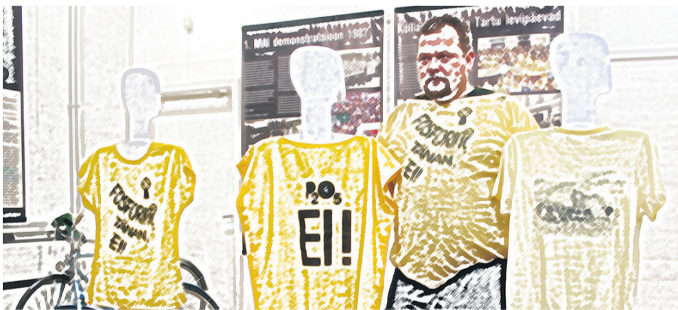
MONTAŽ, FOTO: HENN SOODLA

Emotsionaalne ja emotsioonidele rõhuv on juba selle vastuoludel rajaneva saaga nimetus – teine fosforiidisõda! Me kõik mäletame ja teame, milline positiivne mõju oli fosforiidisõjal.